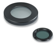
Unità di polarizzazione semplice